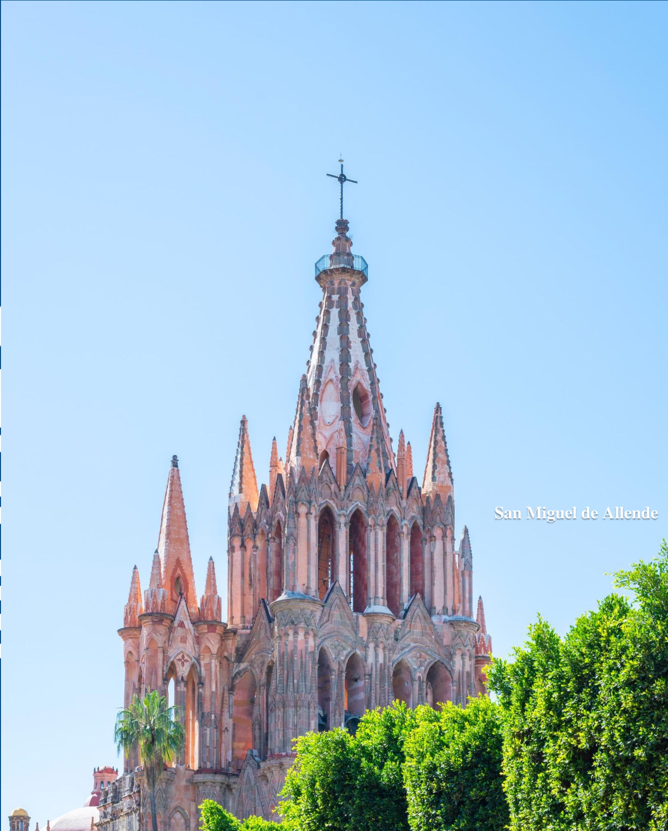
San Miguel de Allende