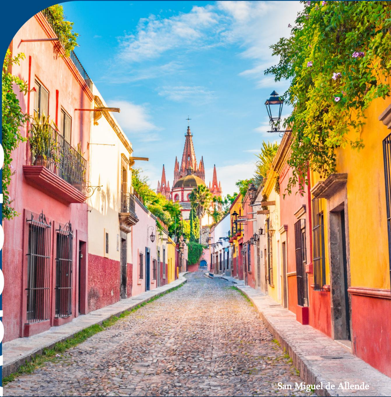
San Miguel de Allende